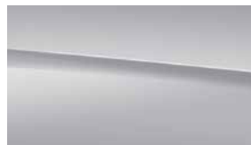
922 科技銀 high-tech silver