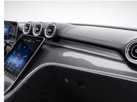
H73 AMG 碳纖維飾板