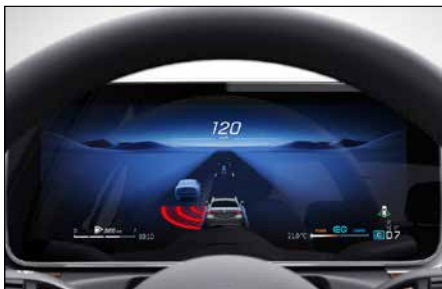
12.3 吋寬螢幕數位儀表 (代碼 464)