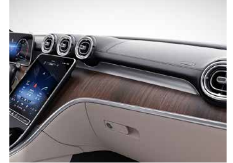
H33 霧面棕色胡桃木飾板