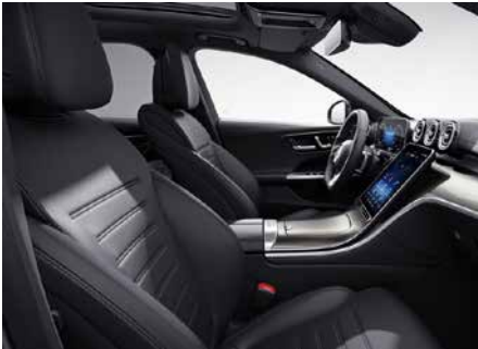
111 ARTICO-黑 black