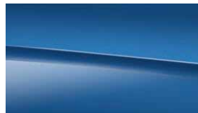
970 光譜藍 spectral blue