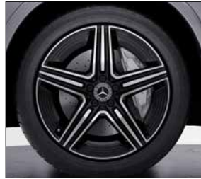
20 吋 AMG 五輻式輕合金輪圈 (代碼 RRN)