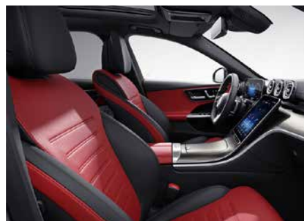
297 真皮雙色-原力紅/黑 power red/black