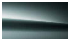
188 銀河綠 verde silver