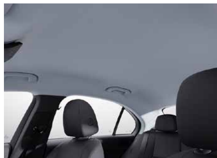
58U 灰色織布車內頂篷