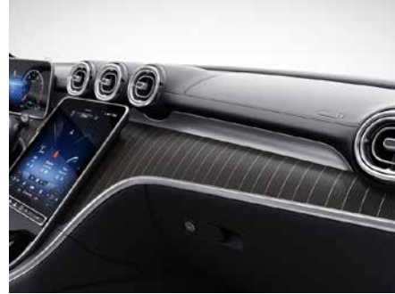
H04 鋁質線條霧面黑色木飾板