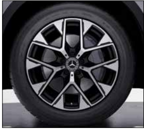
19 吋五輻雙肋式輕合金輪圈 (代碼 R55)