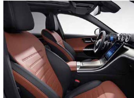
194 ARTICO 雙色-山城棕/黑 sienna brown/black