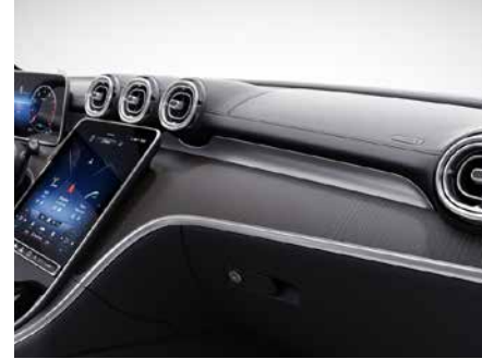
H08 霧面黑色楸木飾板