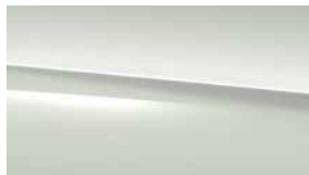
149 白 polar white