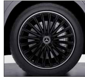
20 吋 AMG 多輻式輕合金輪圈 (代碼 RVP)