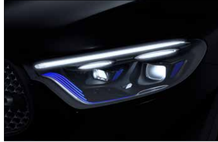
多光束智慧型數位頭燈套件 (含動態投影迎賓功能) (代碼 PAX)