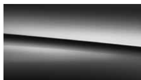
197 鐵黑 obsidian black