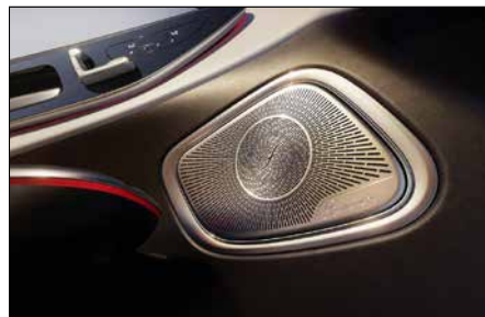
Burmester® 3D 環場音響系統 (代碼 810)