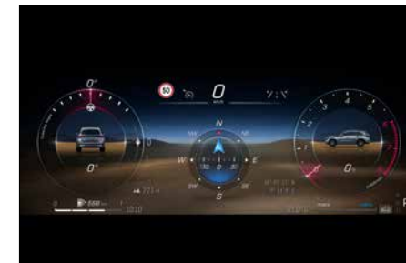
越野駕駛模式介面