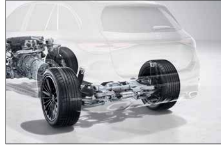
AIRMATIC 氣壓懸吊含後軸轉向系統 (代碼 PAD)