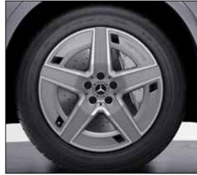
19 吋 AMG 五輻式輕合金輪圈 (代碼 RRD)