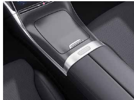
794 中控台灰色菱紋格飾板