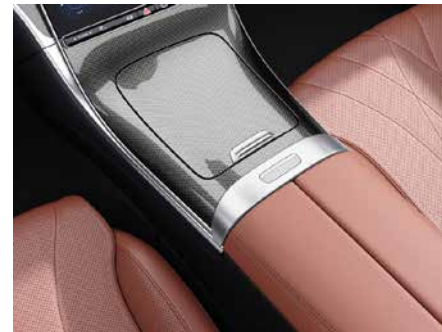
795 中控台金屬編織飾板