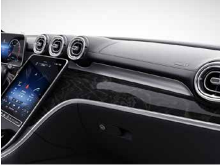
H03 亮面棕色槐木飾板