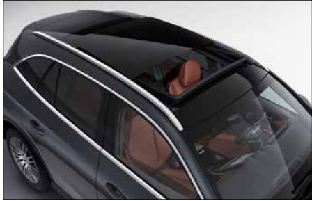
全景式電動玻璃天窗 (代碼 413)