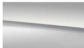
885 瓷釉白 opalite white