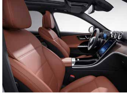
104 ARTICO-山城棕/黑 sienna brown/black