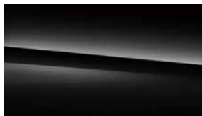
040 黑 black