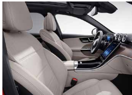
205 真皮-米/黑 macchiato beige/black