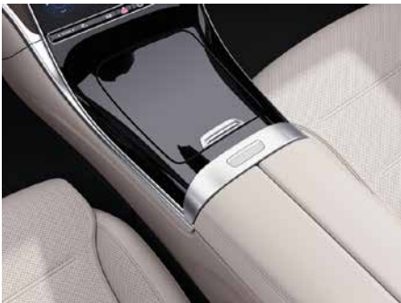
757 中控台亮黑色飾板