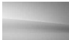
956 層峰灰 alpine grey