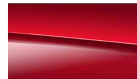
993 野性紅 patagonia red