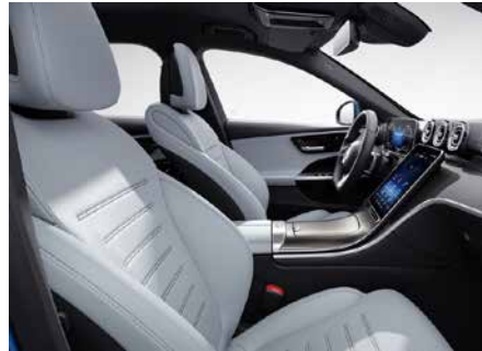
118 ARTICO-淺灰/黑 neva grey/black