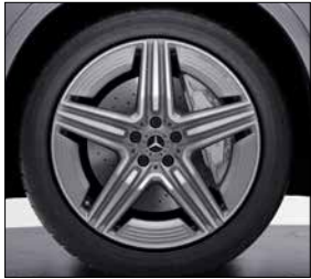
20 吋 AMG 五輻式輕合金輪圈 (代碼 RRM)