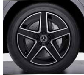
19 吋 AMG 五輻式輕合金輪圈 (代碼 RRE)