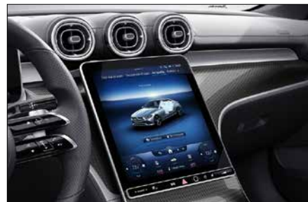
11.9 吋高解析度觸控螢幕 (代碼 868)