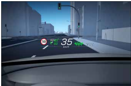
抬頭顯示器 (代碼 444)