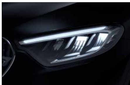
標準型 LED 頭燈