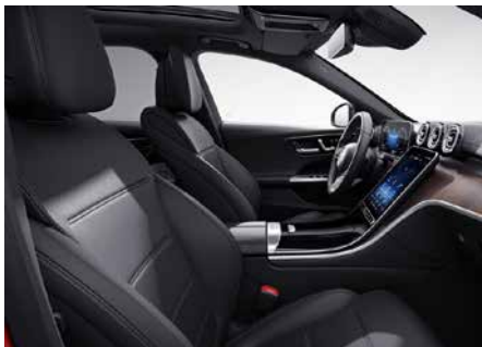
201 真皮-黑 black