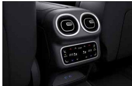
THERMOTRONIC 豪華型多區恆溫空調 (代碼 581)