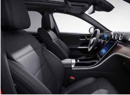
101 ARTICO- 黑 black