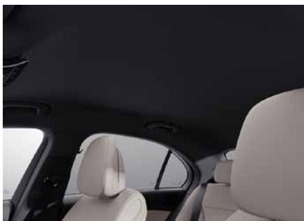
51U 黑色織布車內頂篷