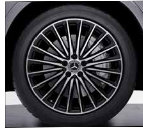
20 吋 AMG 多輻式輕合金輪圈 (代碼 RVO)