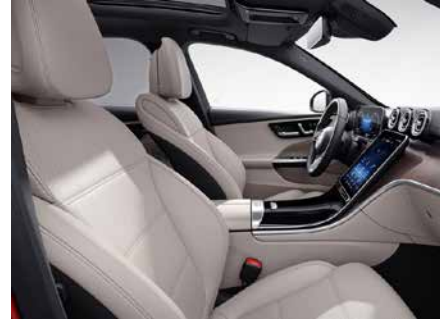
105 ARTICO-米/黑 macchiato beige/black