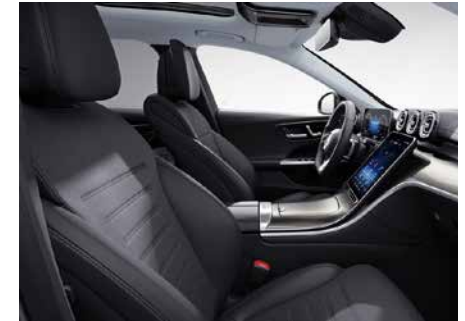
601 ARTICO/MICROCUT-黑 black