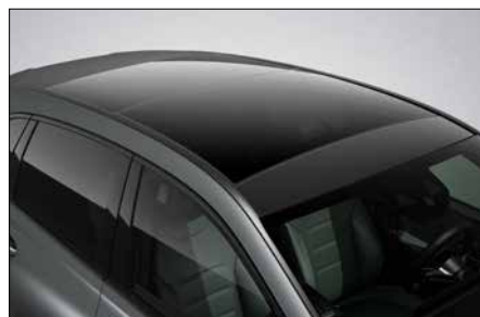
全景式電動玻璃天窗 (代碼 413)

●：標準配備 ●：新增標準配備 ◎：可選配 X：不能加裝 注意：各項配備請以實車為準，原廠保留配備設計變更之權利。