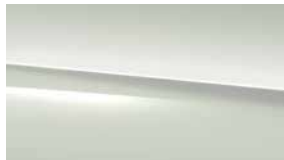
149 白 Polar White