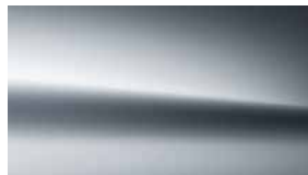
922 科技銀 high-tech silver