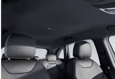
51U 黑色織布車內頂篷