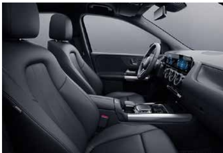
101 ARTICO-黑 black