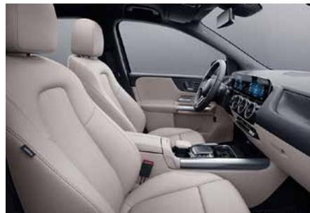
105 ARTICO-米/黑 macchiato beige/black