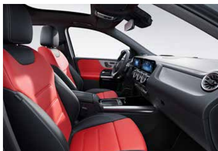
277 真-椒紅/黑雙色 red pepper/black