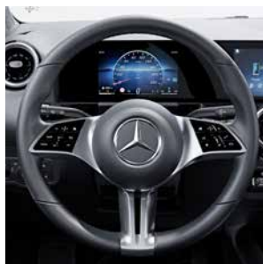
多功能真皮跑車方向盤 (代碼 L3E)