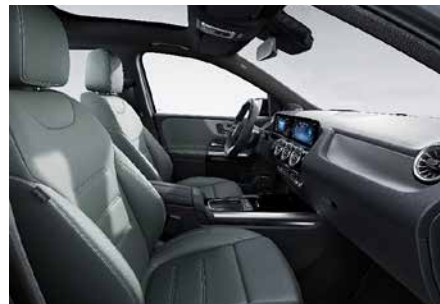
158 ARTICO-淺綠灰/黑 sage grey/black