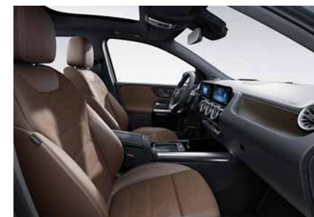
654 ARTICO/MICROCUT-宮殿棕/黑 Bahia brown/black