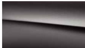
662 消光深灰 mountain grey