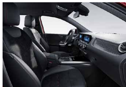
ARTICO/MICROCUT-黑 (附紅色縫線) black