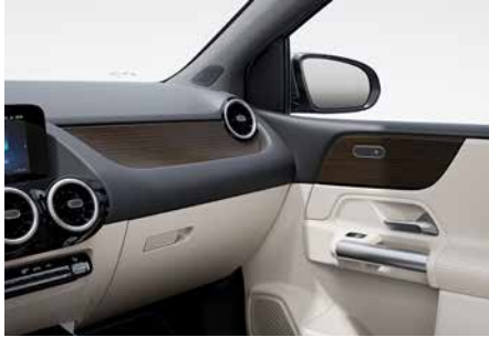
03H 霧面棕色椴木飾板