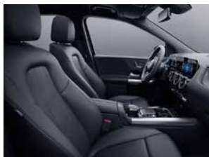
ARTICO-黑 (代碼 101) 舒適型座椅 (代碼 7U2)