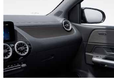
H15 霧面黑色椴木飾板