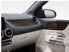
霧面棕色椴木飾板 (代碼 03H)