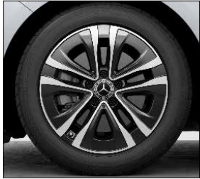
17 吋五輻雙肋式輕合金輪圈 (代碼 25R)