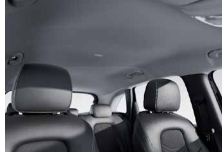
58U 灰色織布車內頂篷