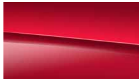
993 野性紅 Patagonia red

※ MANUFAKTUR 消光深灰 (代碼 662) / MANUFAKTUR 野性紅 (代碼 993) 需額外加價選配。 ※實際車色/內裝色請參照原廠提供色樣，原廠保留設計與顏色變更之權利。