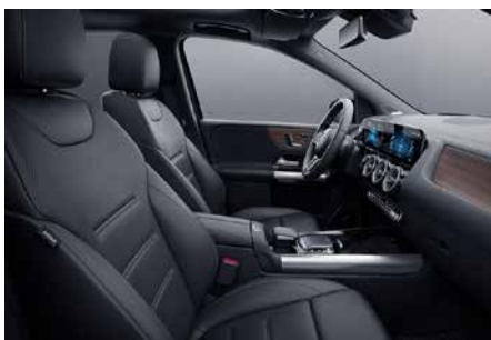
211 真皮-黑 black