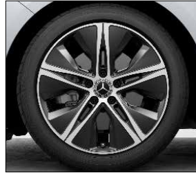
18 吋五輻雙肋式輕合金輪圈 (代碼 R31)