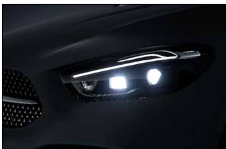
多光束智慧型 LED 頭燈 (代碼 642)