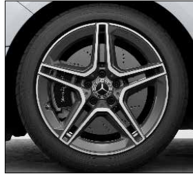
18 吋 AMG 五輻雙肋式輕合金輪圈 (代碼 RQS)