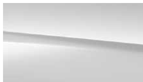
149 白 polar white