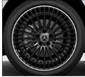
20 吋 AMG 多輻式輕合金輪圈 (代碼 RVW)