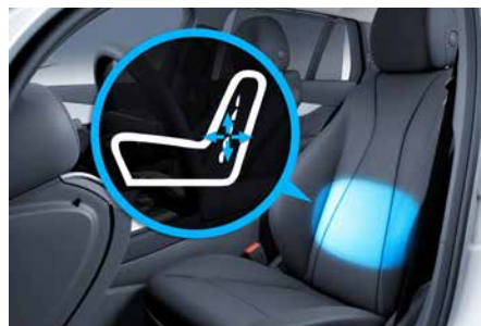
電動雙前座四向腰靠調整