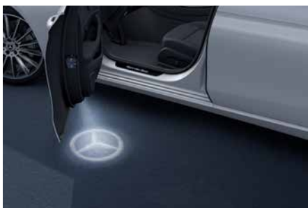
雙側賓士 Logo 投射燈 (代碼 586)