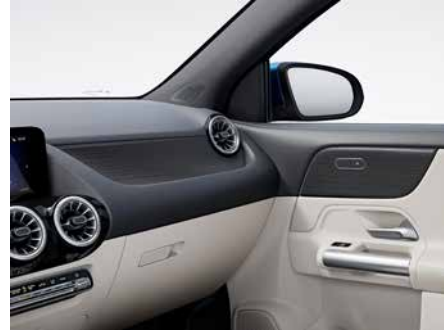
H15 霧面黑色椴木飾板