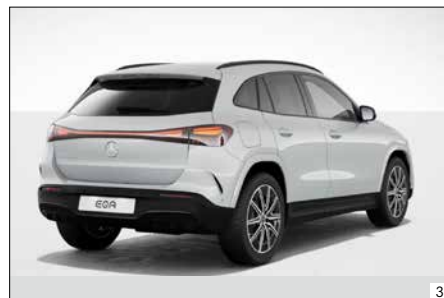
圖片不含標配之後保桿上方鍍鉻護片