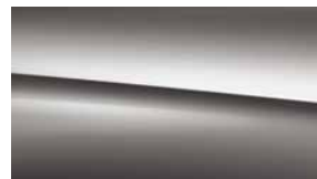
787 深灰 mountain grey