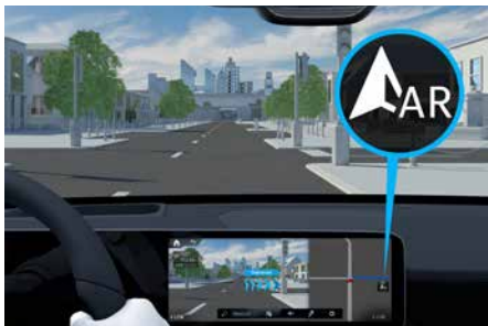
MBUX 擴增實境導航功能