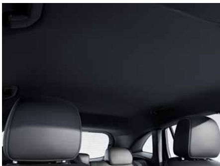
51U 黑色織布車內頂篷