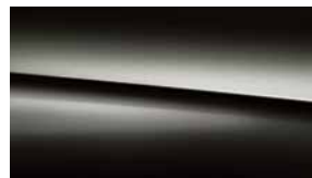
191 亮黑 cosmos black