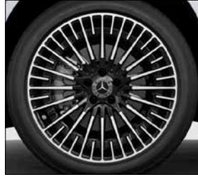
20 吋 AMG 多輻式輕合金輪圈 (代碼 RVU)