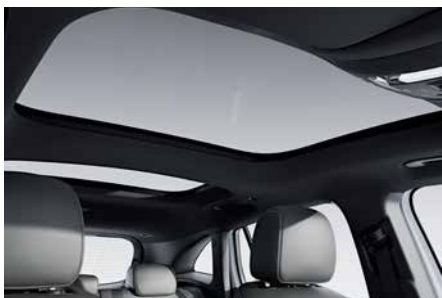
全景式電動天窗 (代碼 413)