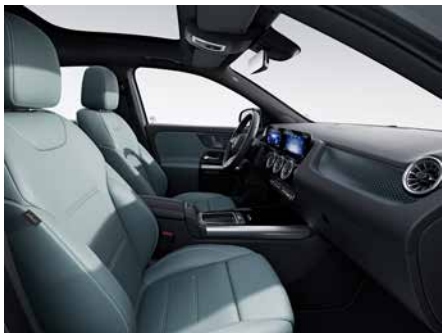
158 ARTICO-淺綠灰/黑 sage grey/black