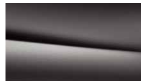
662 消光深灰 mountain grey