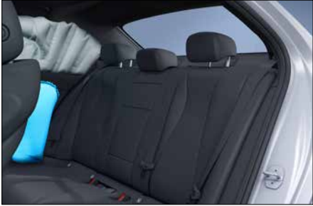
後座側面氣囊 (代碼 293)