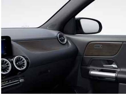
03H 霧面棕色椴木飾板