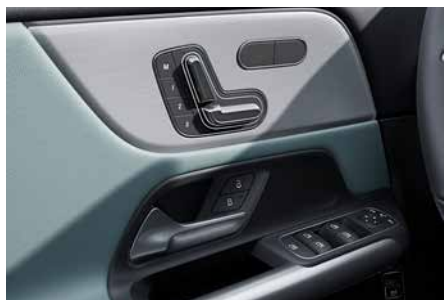
電動雙前座椅附記憶功能