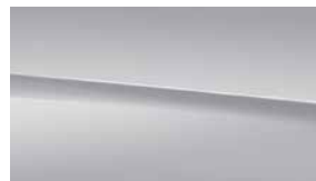
922 科技銀 high-tech silver