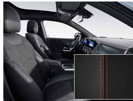
651 ARTICO/MICROCUT-黑 black (附紅色車縫線)