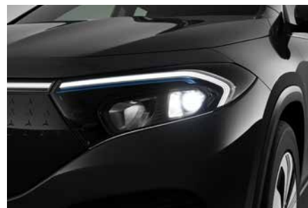
標準型 LED 頭燈