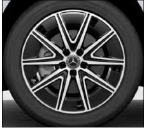
19 吋 AMG 十輻式輕合金輪圈 (代碼 RVY)