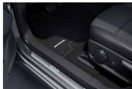
可替換門檻飾板附照明 (代碼 U45)