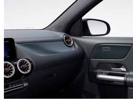
56H 星芒浮紋背光飾板