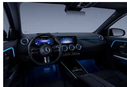
環景式內裝照明 (含 64 色氛圍燈)