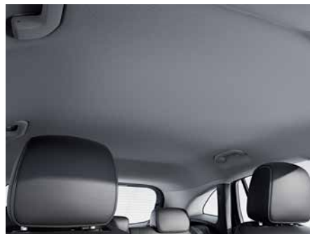
58U 灰色織布車內頂篷