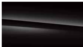
696 黑 night black