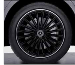
20 吋 AMG 多輻式輕合金輪圈 (代碼 RVP)