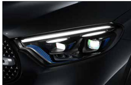
多光束智慧型數位頭燈套件 (含動態投影迎賓功能) (代碼 PAX)