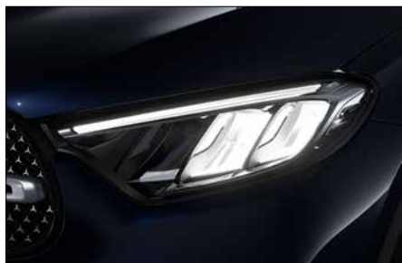
標準型 LED 頭燈