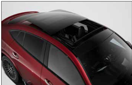
全景式電動玻璃天窗 (代碼 413)