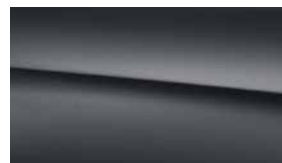
818 消光墨灰 graphite grey magno