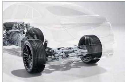
AIRMATIC 氣壓懸吊含後軸轉向系統 (代碼 PAD)