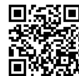
台灣賓士資融官方 LINE 帳號

Mercedes-Benz 不僅於造車工藝追求完美，更期望圓滿所有用車環節。台灣賓士資融提供你多元化的分期專案、彈性的租賃選擇及量身打造的保險方案。請立即掃描 QR Code，了解賓士各車款最新分期購車優惠、試算最適合你的財務規劃，註冊登入 myMBFS 行動查詢，隨時管理你的分期購車/租賃合約！