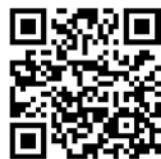
Mercedes-Benz Pass 賓士暢行

為了實踐關懷車主的承諾，台灣賓士提供各項完善的貼心服務來滿足你的需要，包括：轎車三年不限里程保固、非消耗性自費零件一年不限里程零件保固、Mercedes-Benz 24 小時道路救援服務專線 (08000-365-24) 等。此外，為了享受完整的車主禮遇，請你即刻掃描 QR Code，以 Mercedes-Benz 帳號登入「Mercedes-Benz Pass 賓士暢行」，除了整合停車、代駕與充電服務的實用功能以外，更有 24 小時禮賓專線服務、頂級飯店與餐廳優惠、以及各種車主專屬的品牌活動等尊享禮遇，現在就開啟你的賓士世界！